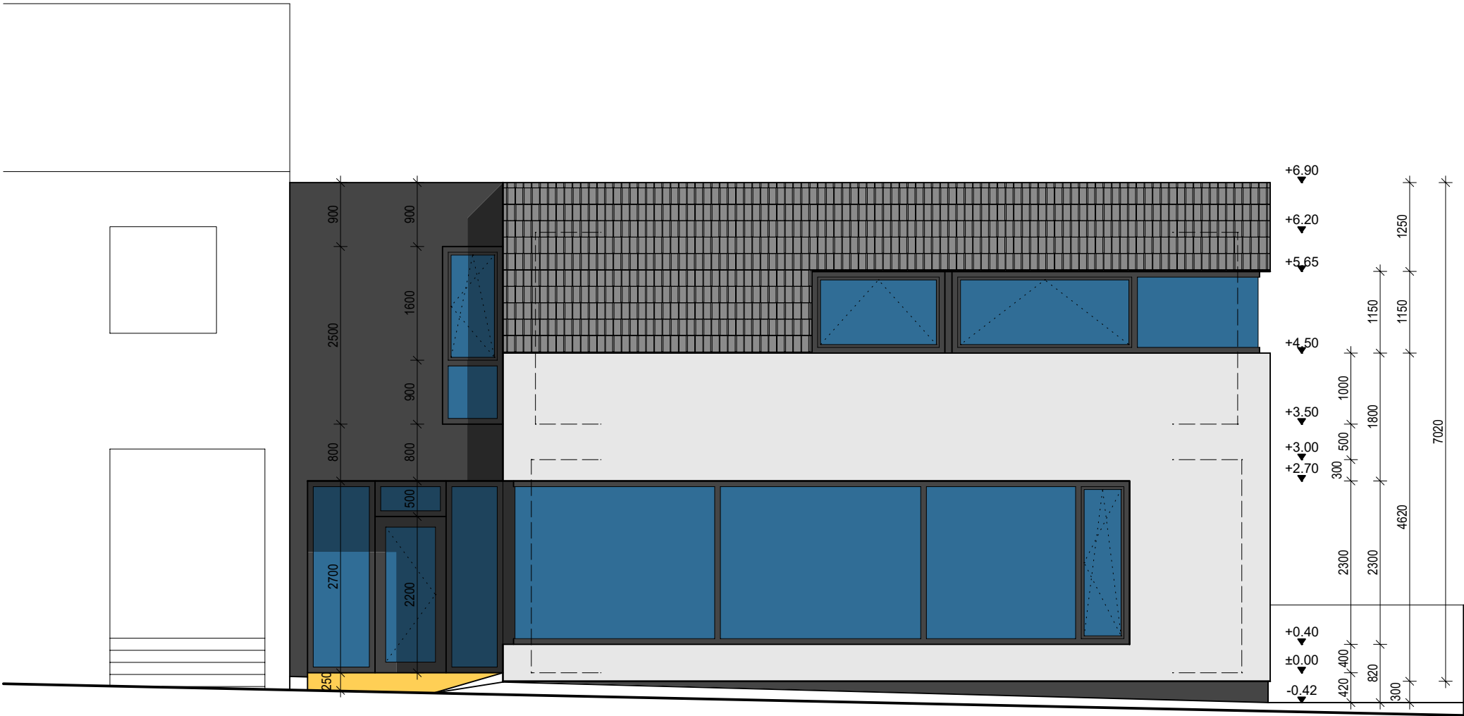
pohled od jihu - z ulice