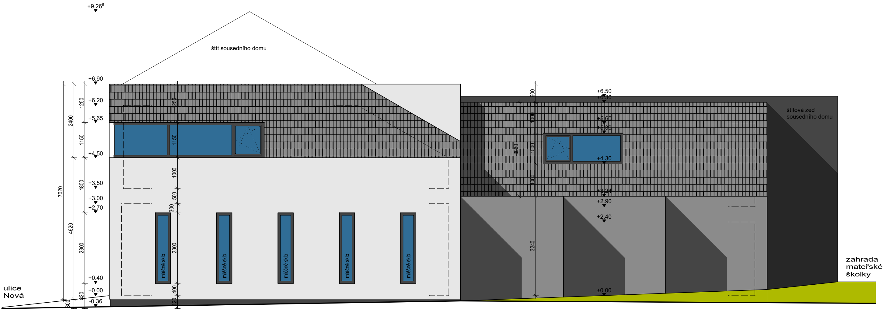
pohled od východu - od sousedního RD