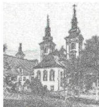
Kostel Narození Panny Marie, Vranov