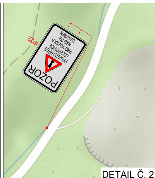
DETAIL Č. 2

Použité dopravní značení bude v základní velikosti a v reflexním provedení tř.1 K návrhu dopravního značení bylo využito: TP 65 Zásady pro dopravní značení na pozemních komunikacích TP 66 Zásady pro označování pracovních míst na pozemních komunikacích, II. vydání